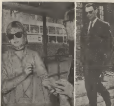
Riba e promer grafica nos por mira Marilyn (Mandy) Rice-Davies, y riba e otro Dr. Stephen Ward.